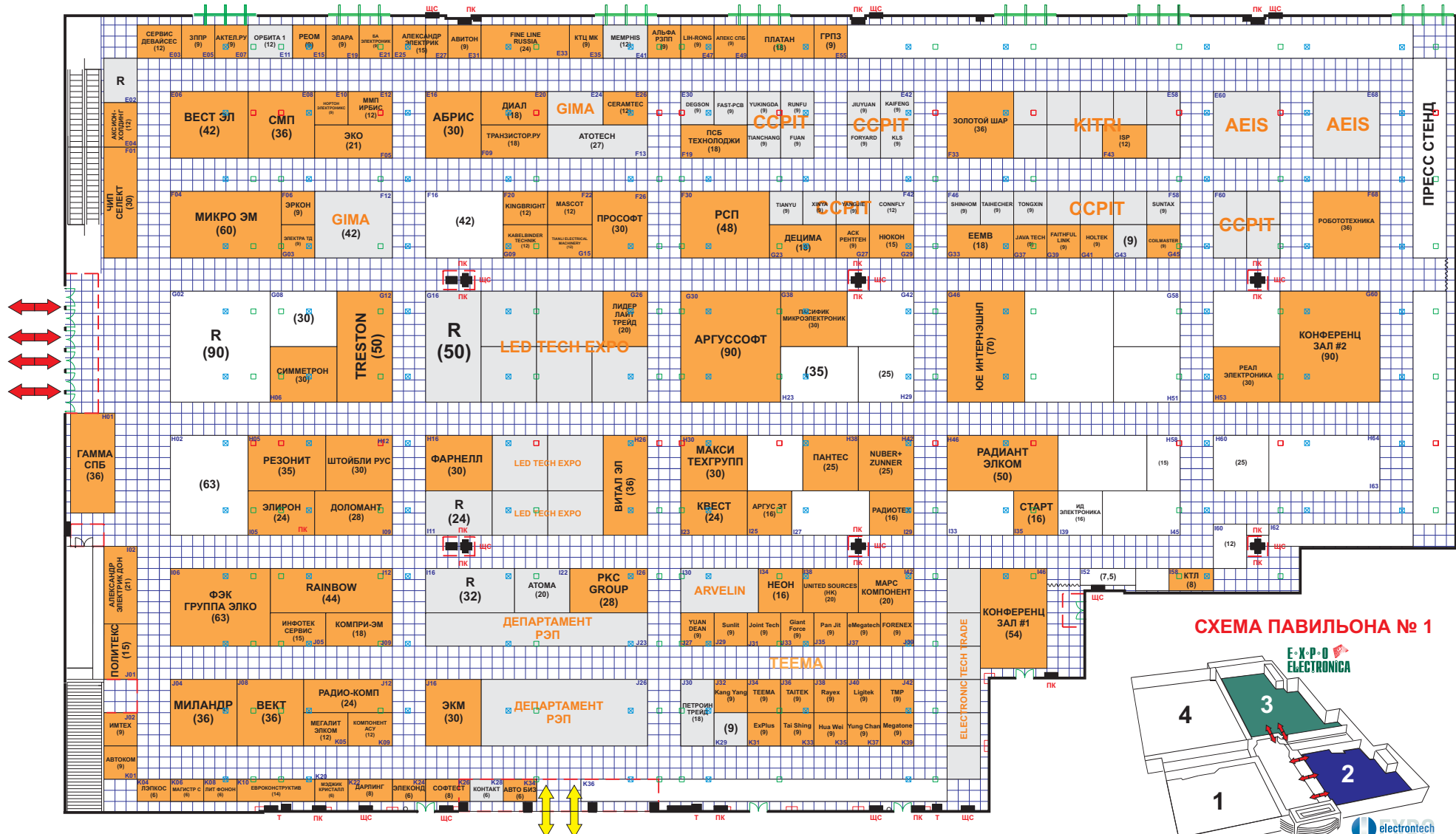
СХЕМА ПАВИЛЬОНА № 1